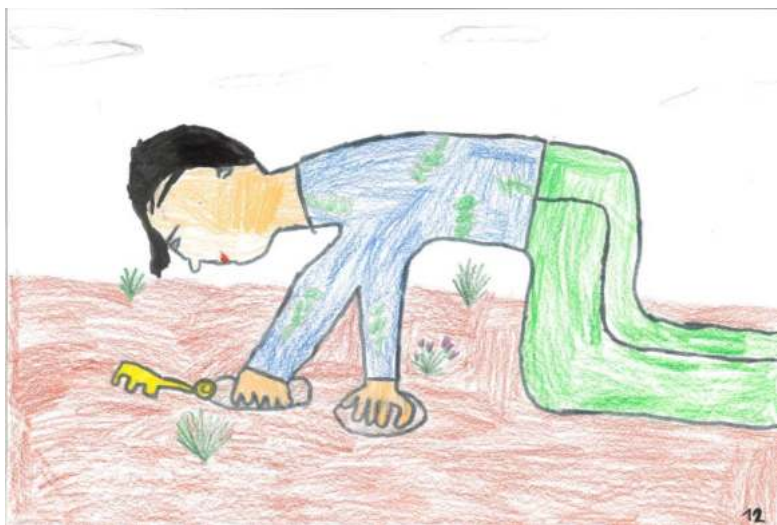
Ecole de Sainte-Christie - 2022