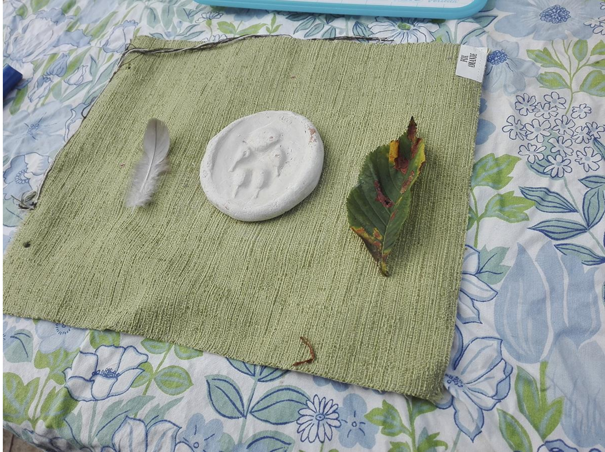
Les 3 objets...